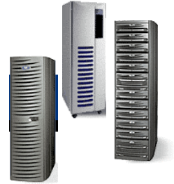
Symmetrix, Clariion, Centra

EMC en las soluciones de infraestructura de información es la fundadora de esta misión. Una infraestructura de información EMC unifica tecnologías de almacenamiento conectadas en una red de computadoras SAN, NAS, CAS), plataformas de almacenamiento (mainframe y abiertas), software, y servicios para ayudar a las organizaciones a mejorar y obtener un manejo de costo efectivo, protegido y con información compartida.